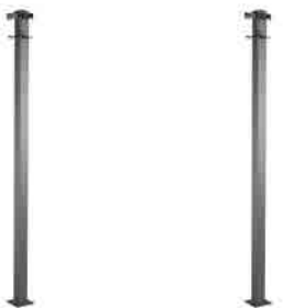
Querträger (lang, gerade) 2x