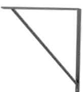
I Eck-Dekor 96° Winkel 2x