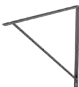
H Eck-Dekor 84° Winkel 2x